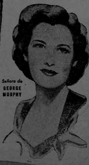
Señora de GEORGE MURPHY

Distribuidores: ALMACEN PALACIOS — San José