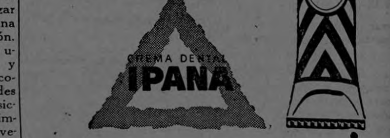
Un producto de Bristol-Myers Co.

Masaje diariamente sus encías con IPANA, porque el masaje con IPANA estimula la circulación y ayuda a conservar las encías sanas y saludables.